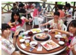
夏の野外学習にて